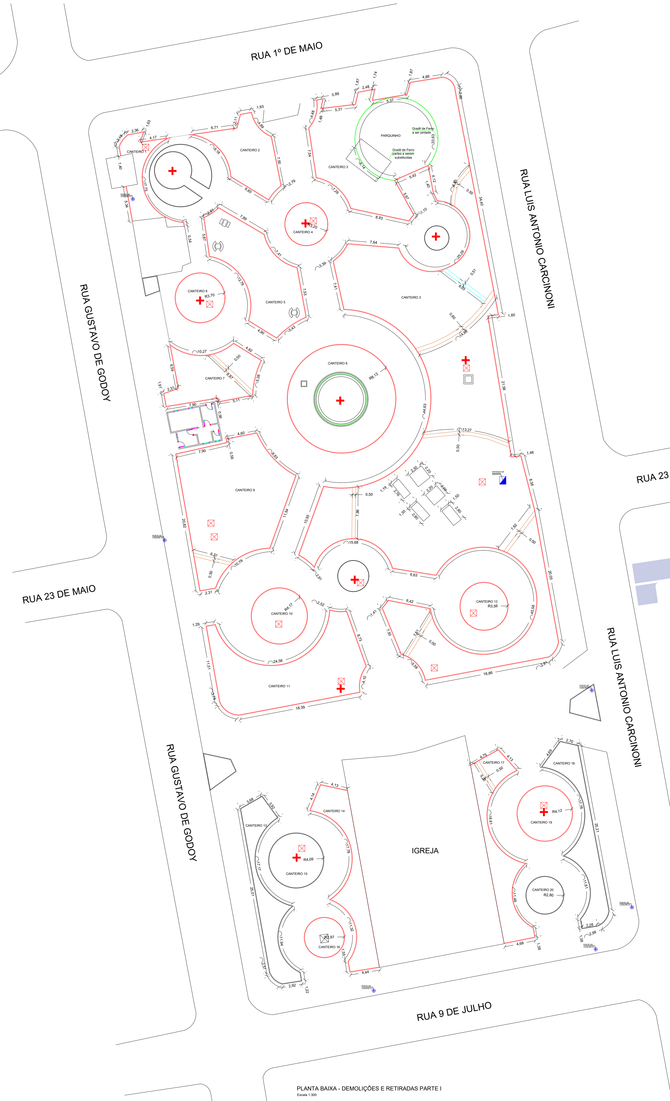
PLANTA BAIXA - DEMOLIÇÕES E RETIRADAS PARTE I Escala: 1:300