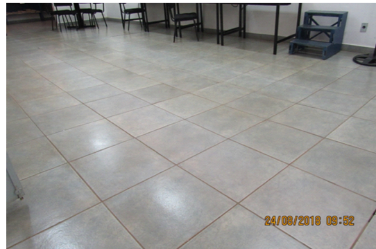
Foto 01 - Piso da Sala de Acervos