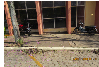
Foto 01 - Vista da Fachada