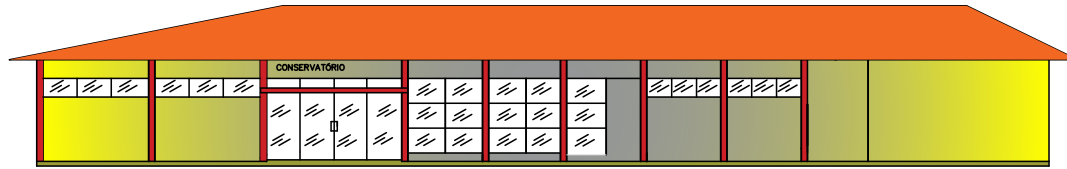
FACHADA Escala 1 / 100