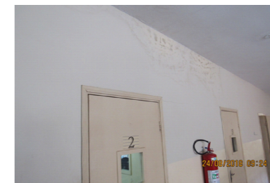
Foto 03 - Vista das Salas de Aula