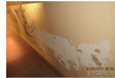
Foto 01 - Vista da Parede Interna