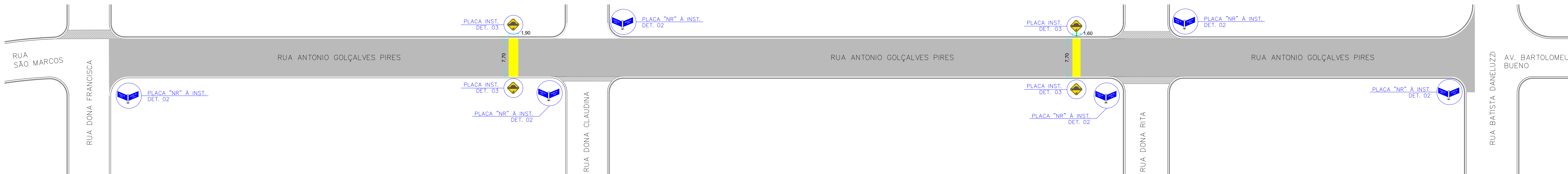
RUA ANTONIO GOLÇALVES PIRES Escala 1:400