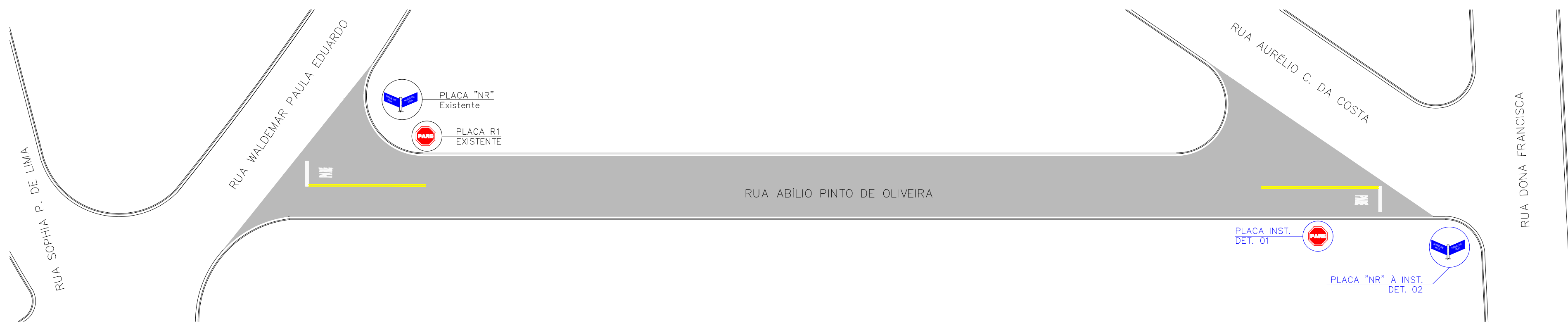
RUA ABÍLIO PINTO DE OLIVEIRA Escala 1:400