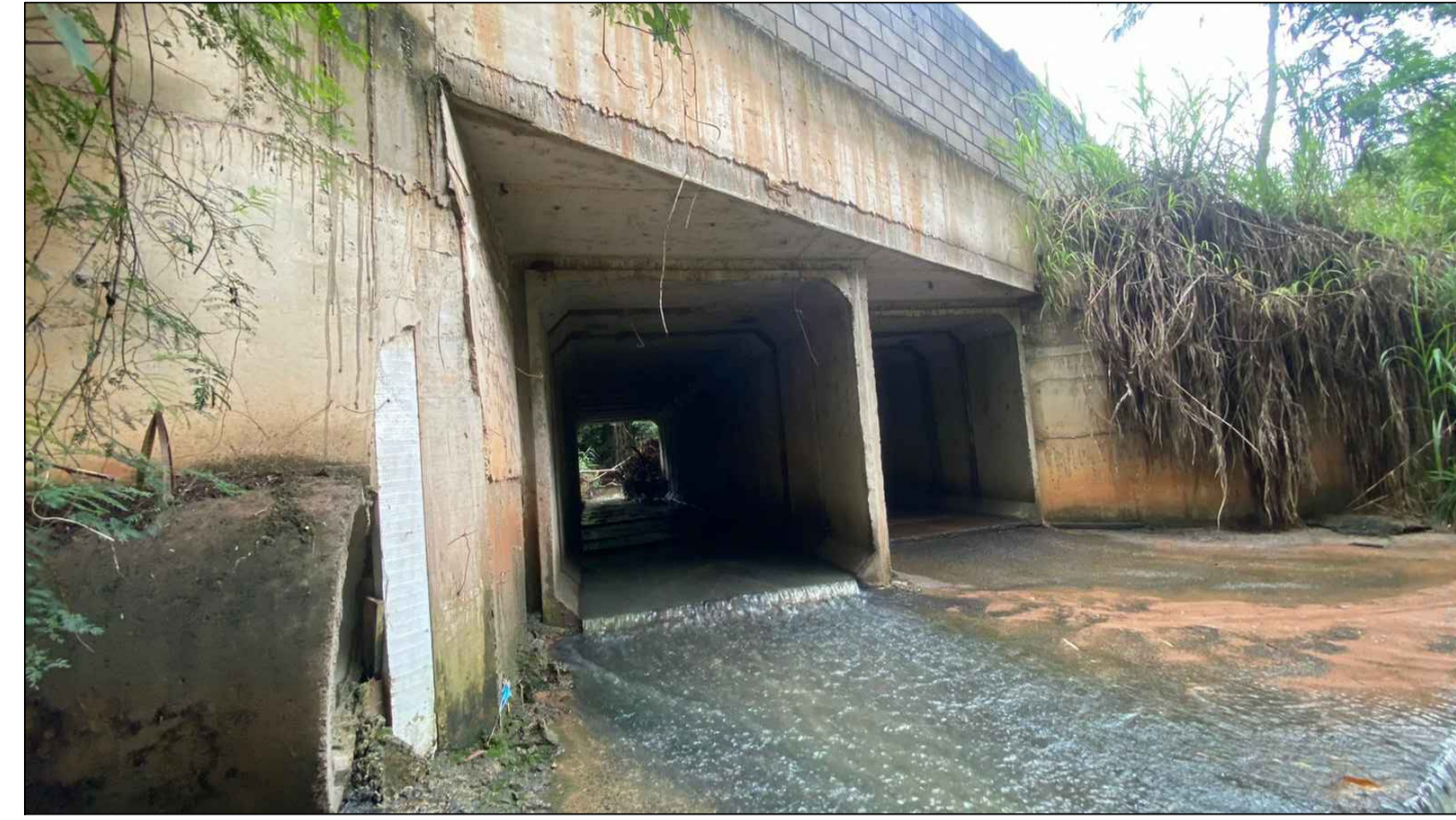
VISTA DA PASSAGEM EXISTENTE A MONTANTE