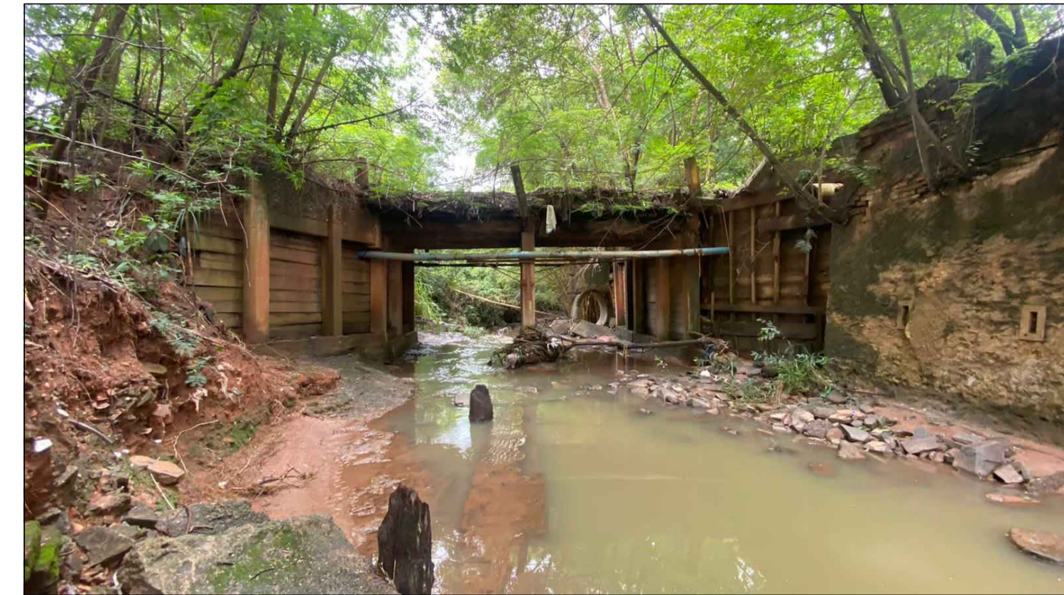
VISTA DO LOCAL ONDE SERÁ CONSTRUIDA A PONTE