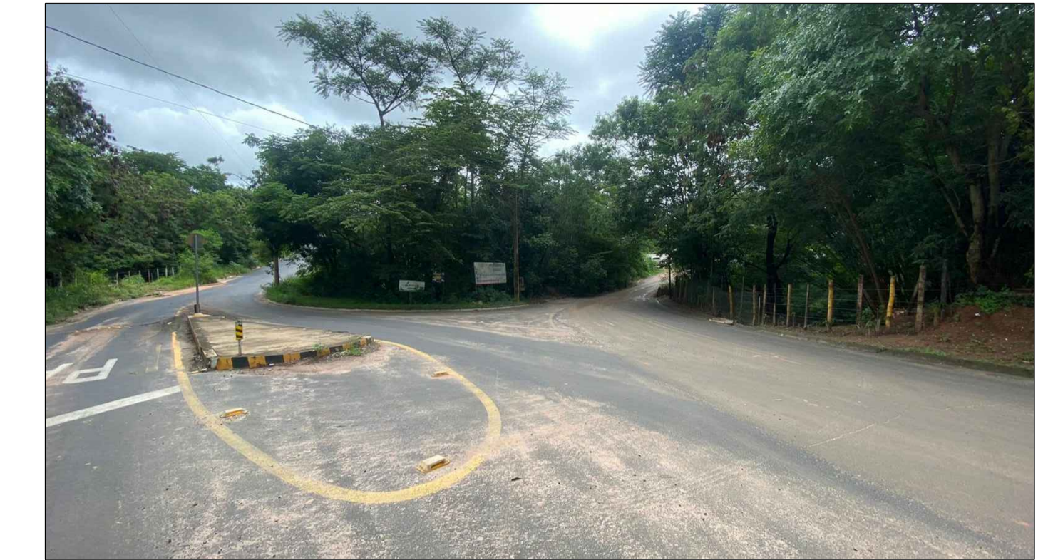
VISTA DA RUA BRUNO MAIDA