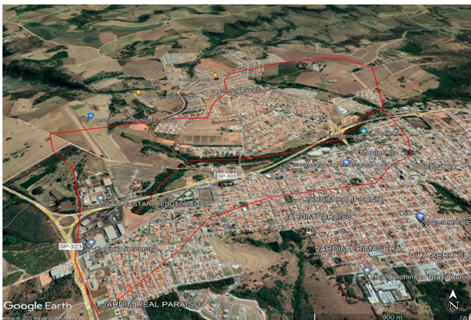
Figura 4 - IMAGEM DO GOOGLE COM A LOCALIZAÇÃO DA ÁREA DE INFLUÊNCIA