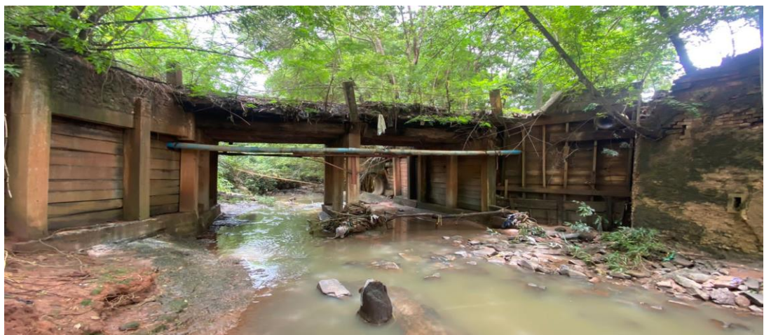
Figura 1- VISTA DO LOCAL A SER CONSTRUIDO