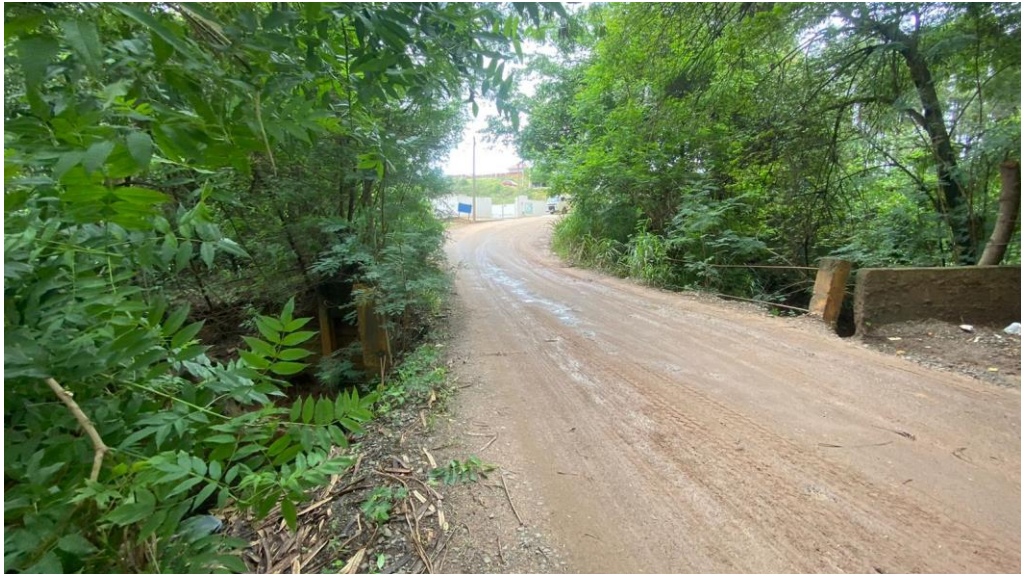
Figura 2 - VISTA DO FINAL DA RUA BRUNO MAIDA PARA A PONTE