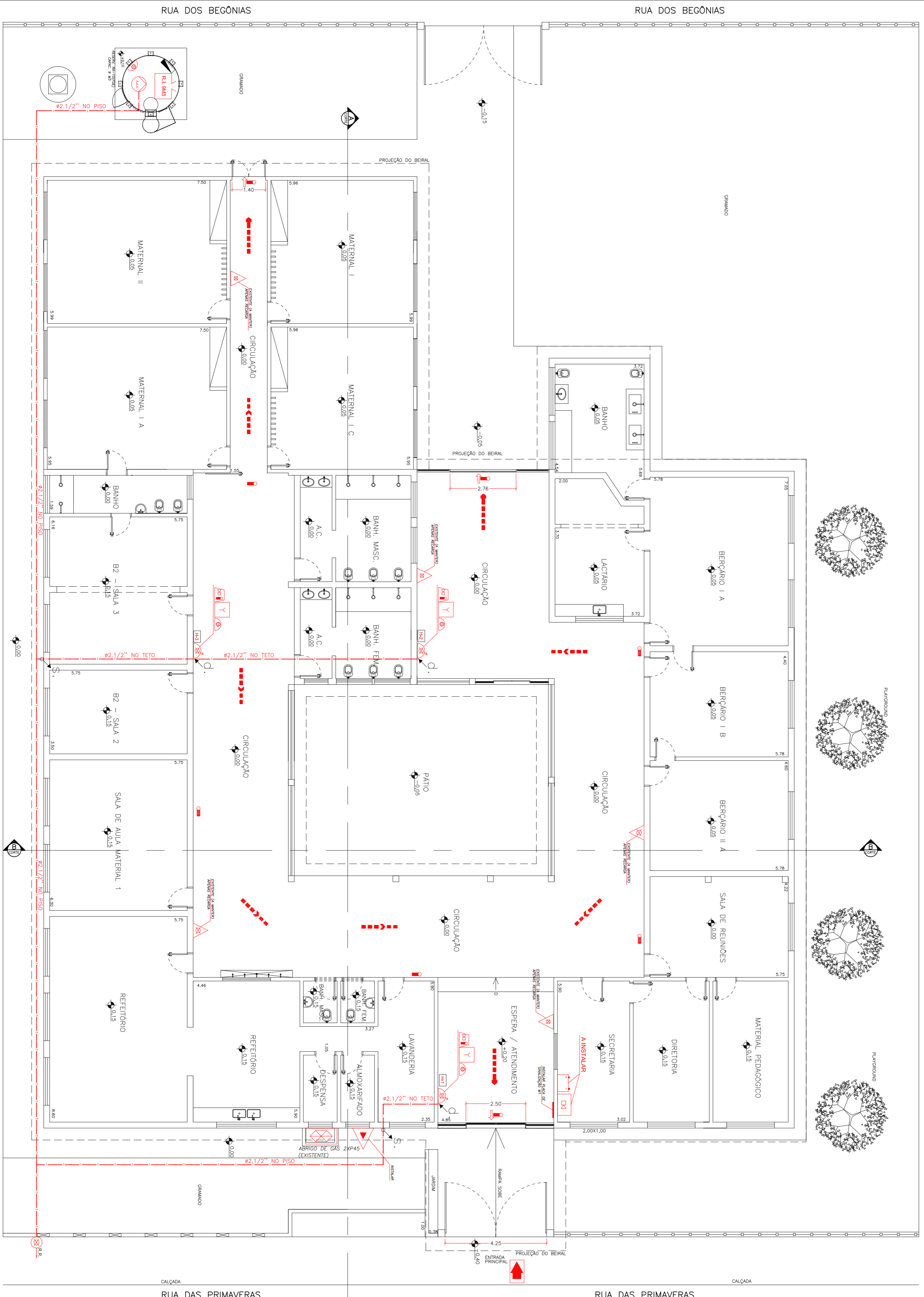
IMPLANTAÇÃO / PLANTA BAIXA ESCALA 1:100