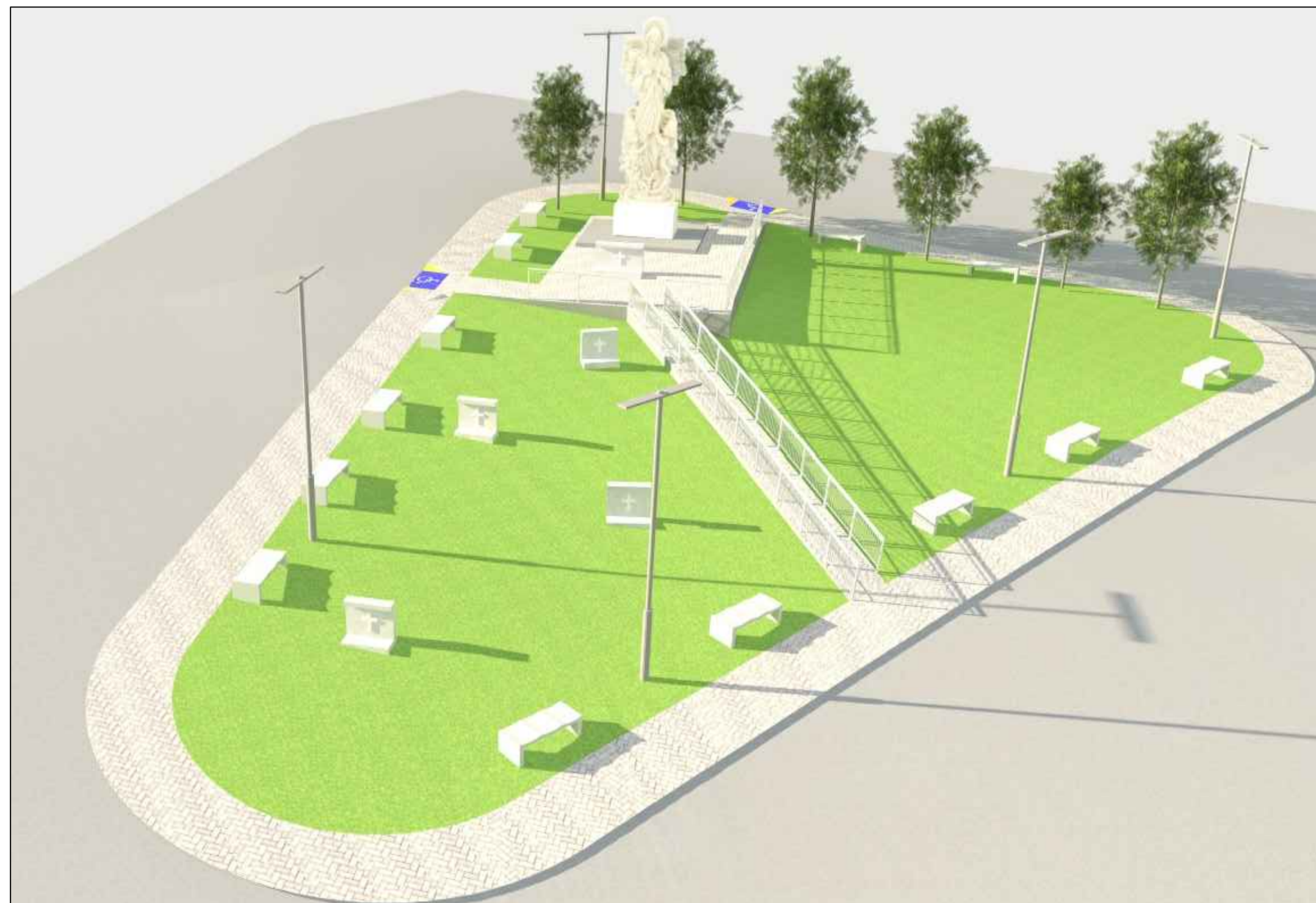
PERSPECTIVA 03 SEM ESCALA