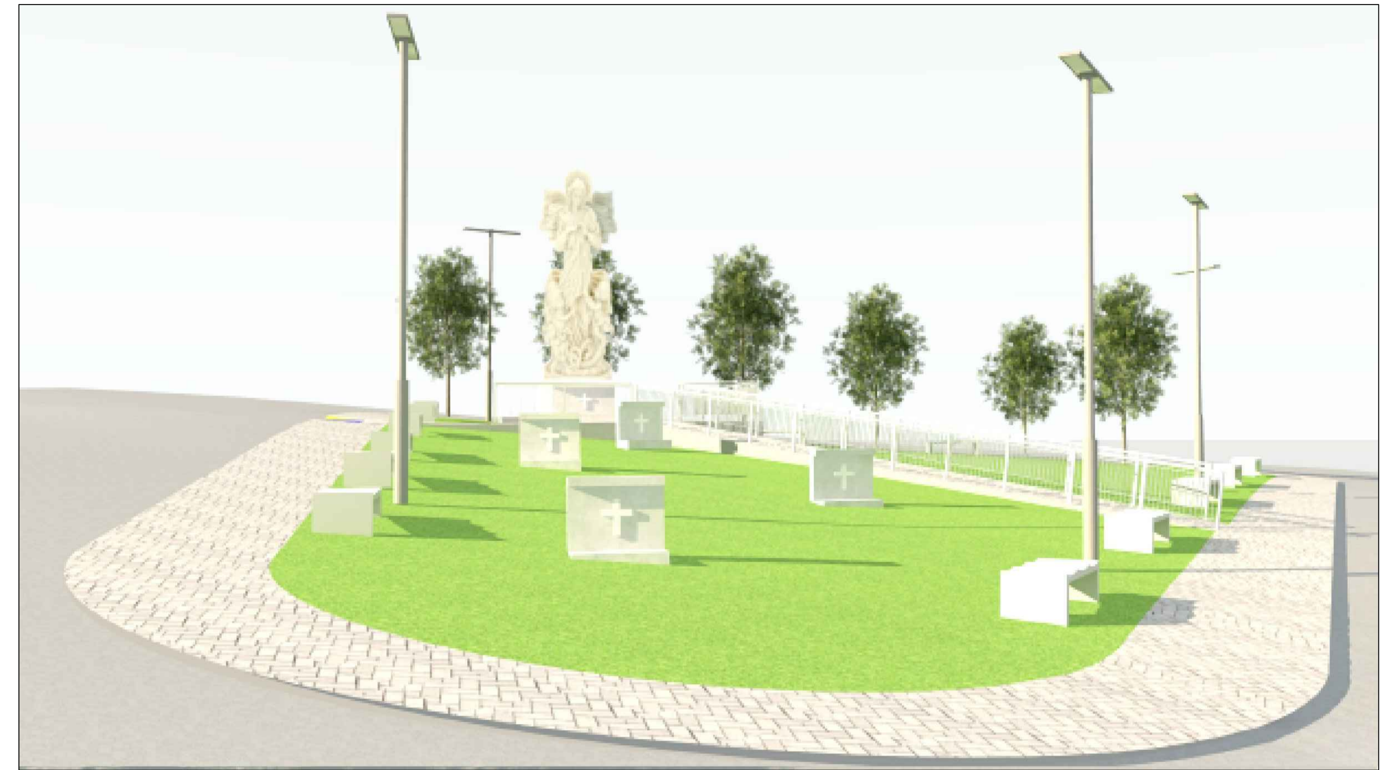
PERSPECTIVA 02 SEM ESCALA