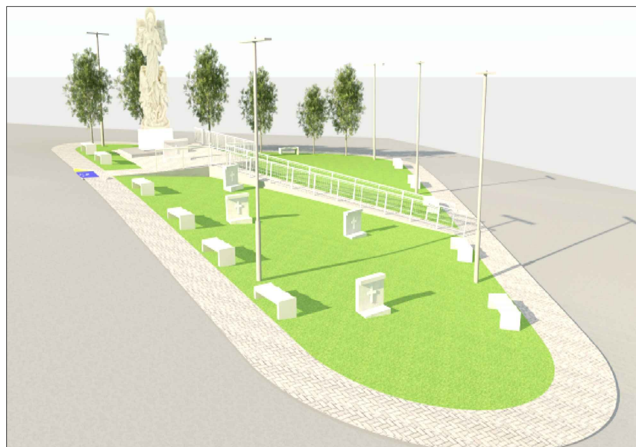
PERSPECTIVA 04 SEM ESCALA