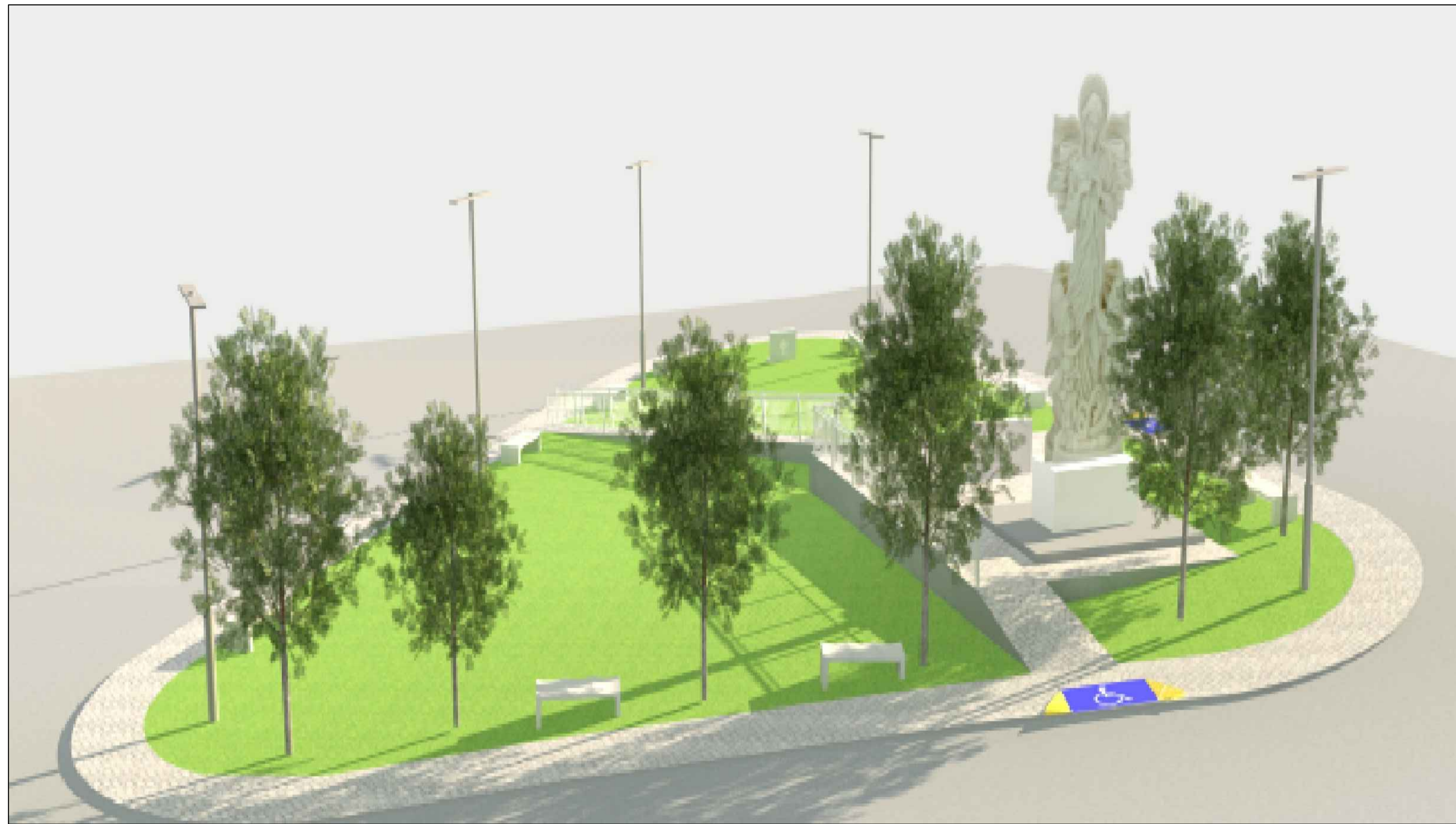
PERSPECTIVA 01 SEM ESCALA